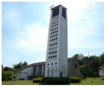
Evangelische Auferstehungs- kirche Ludweilerstr. 62 Wehrden / Geis- lautern