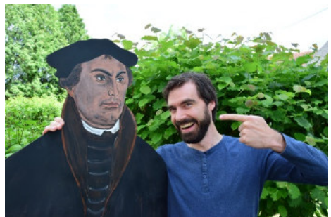
Eindrücke vom ökumenischen Gemeindefest.