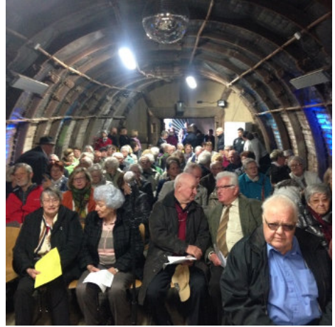
In der "Knubbebud".

Gottesdienste an besonderen Orten zu halten, war eine der Ideen, die den Gemeinden für das Reformationjubiläum mitgegeben wurden. Wir haben die Idee aufgegriffen und zu einem Gottesdienst in der „Knubbebud“ des Erlebnisbergwerks Velsen eingeladen.