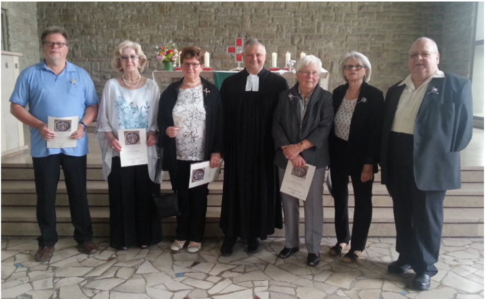
Jubiläumskonfirmation in Wehrden/Geislautern, Sonntag, 18. Juni.