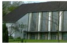
Evangelische Gemeinde- räume Ludweilerstr. 62 Wehrden / Geis- lautern