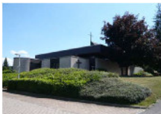
Evangelische Kreuzeskirche Am Hasseleich 17 Fürstenhausen