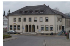
Evangelisches Gemeindehaus Vereinshaus- strasse 14 Fürstenhausen