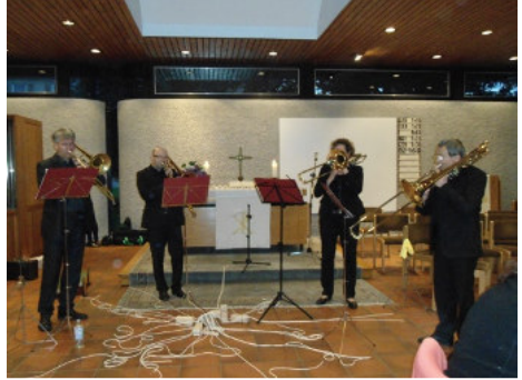
Das Posaunenensemble Warndt.

Der Förderkreis freut sich auf Ihren Besuch am 5. November, um 17 Uhr,