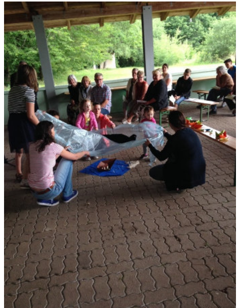
... das Boot der Jünger gerät. Doch Jesus hilft.