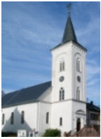
Evangelische Hugenotten- kirche Völklinger Str. 90 Ludweiler