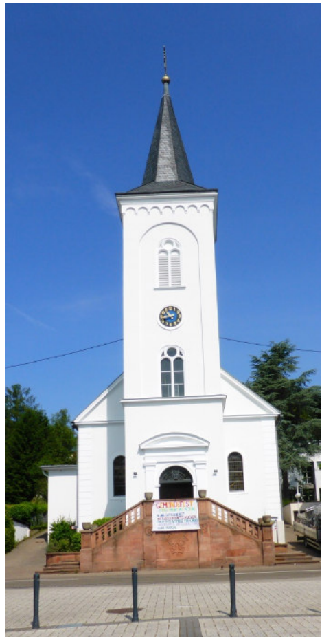
Die renovierte Hugenottenkirche.