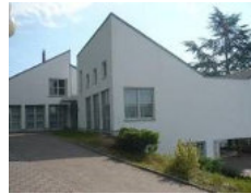
Johannes- Calvin-Haus Völklinger Str. 90 Ludweiler