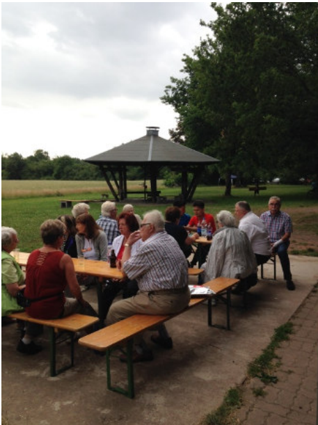
Picknick nach dem Gottesdienst.

Wir haben uns zum Gottesdienst in die Natur begeben. Genauer gesagt in die Florianshütte bei Ludweiler.