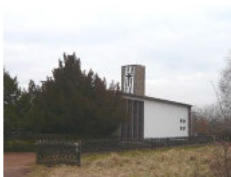
Evangelische Kirche Naßweiler Bremerhof 30 Naßweiler