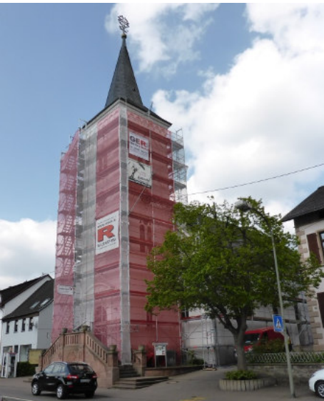
Während der Renovierung.