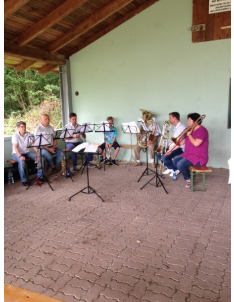
Der Posaunenchor sorgt für die Musik.