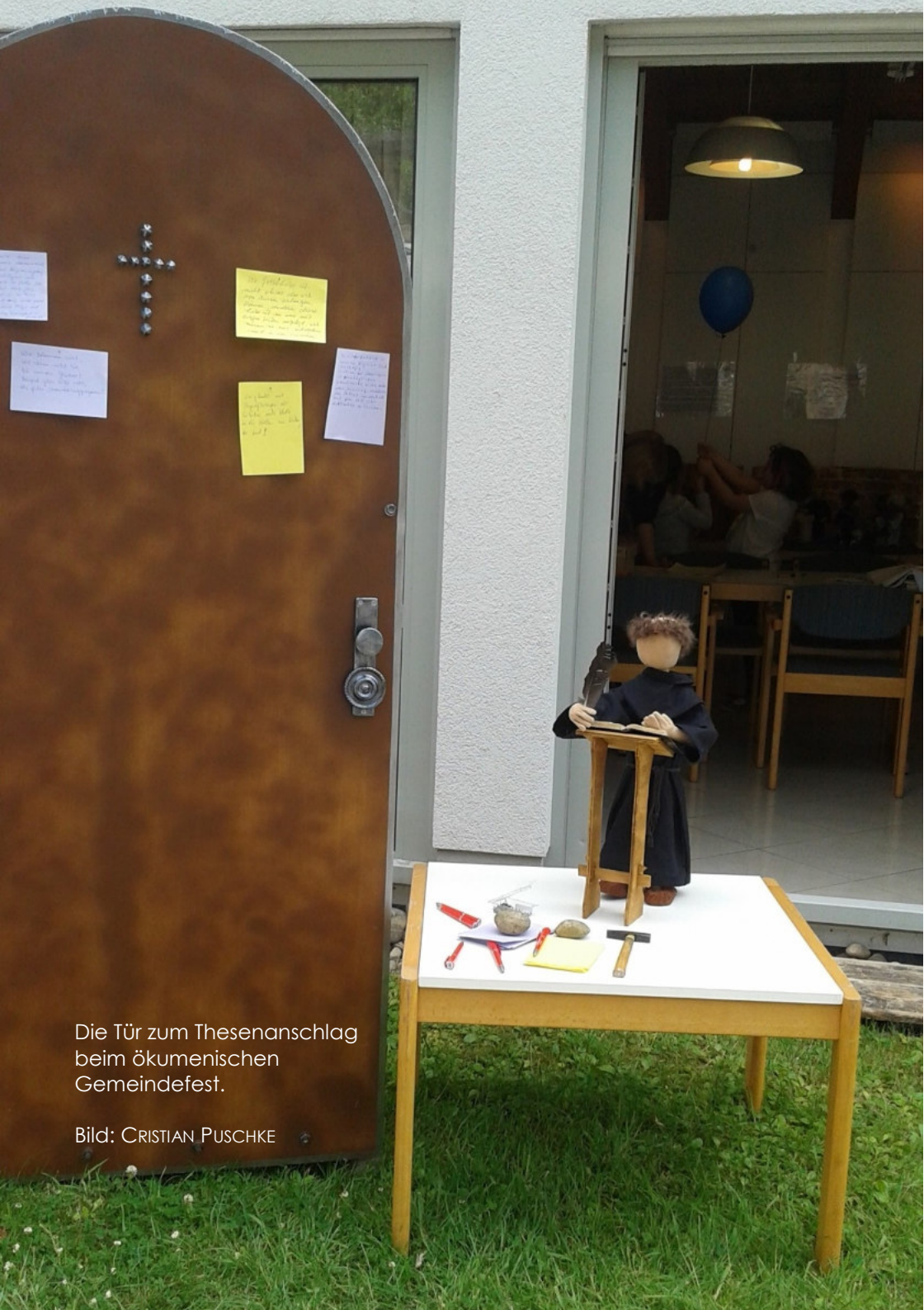
Die Tür zum Thesenanschlag beim ökumenischen Gemeindefest.