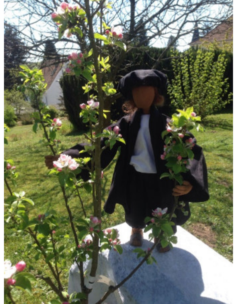
Luther pflanzt ein Apfelbäumchen.