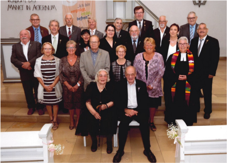
Jubiläumskonfirmation in Ludweiler, Sonntag, 11. Juni.

50, 60, 65, 70 oder gar 75 Jahre Konfirmation zu feiern ist etwas Besonderes. In Ludweiler, Karlsbrunn und Wehrden/Geislautern folgten Jubiläumskonfirmanden und -konfirmandinnen der Einladung, dies in einem Gottesdienst feierlich zu begehen.