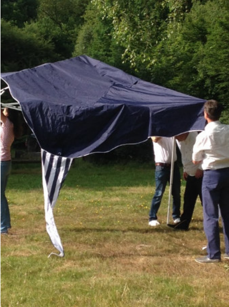
Aufbau des Zeltes für die Kinderkirche.