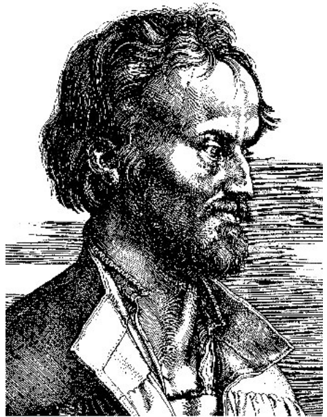
Philipp Melanchthon. Portraitiert von Albrecht Dürer, 1526

Das Augsburger Bekenntnis wird im Evangelischen Gesangbuch auf den Seiten 1363 bis 1376 wiedergegeben.