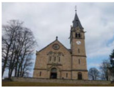
Evangelische Kirche Karlsbrunn Fröbelweg / Jahnstraße Karlsbrunn