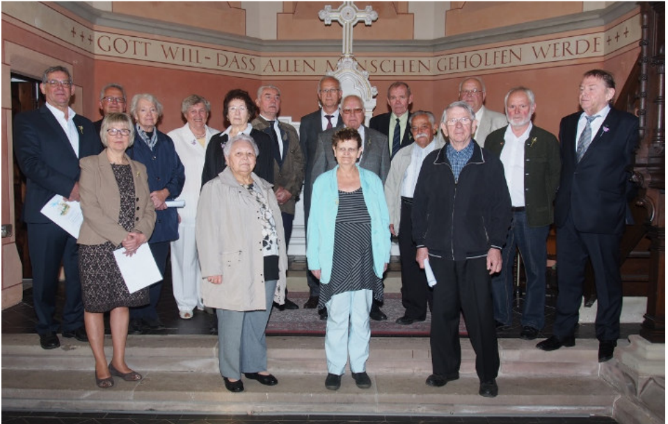
Jubiläumskonfirmation in Karlsbrunn, Sonntag, 9. April.