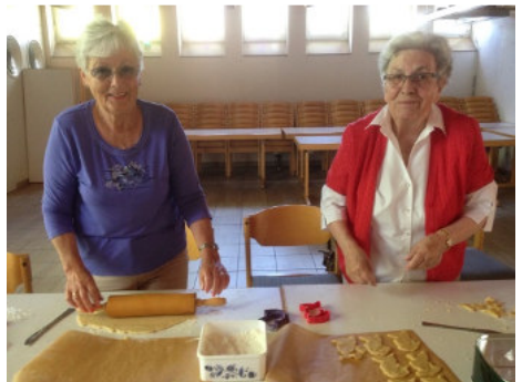
Die Frauenhilfe Ludweiler in Aktion.