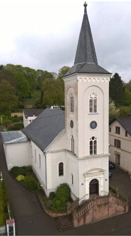
Die Kirche vor der Renovierung.