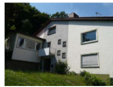
Evangelische Akademie Ludweilerstr. 60 Wehrden / Geis- lautern