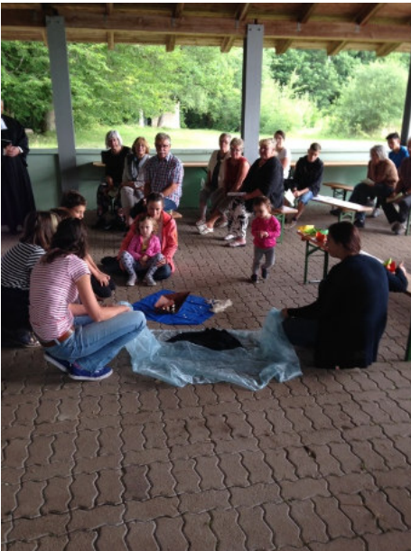
Die Kinderkirche zeigt den Seesturm, in den ...